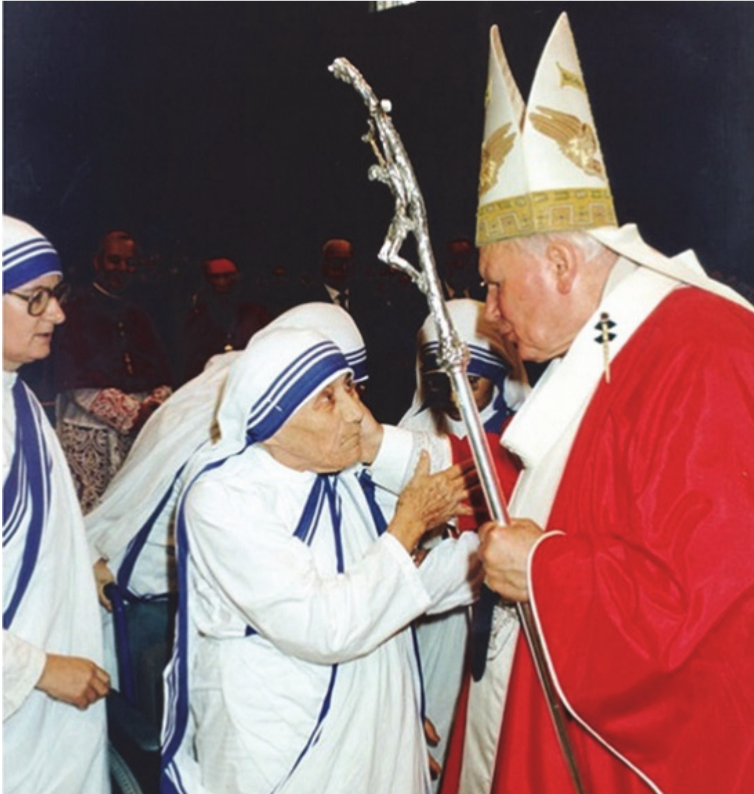
Папата Јован Павле II и Мајка Тереза