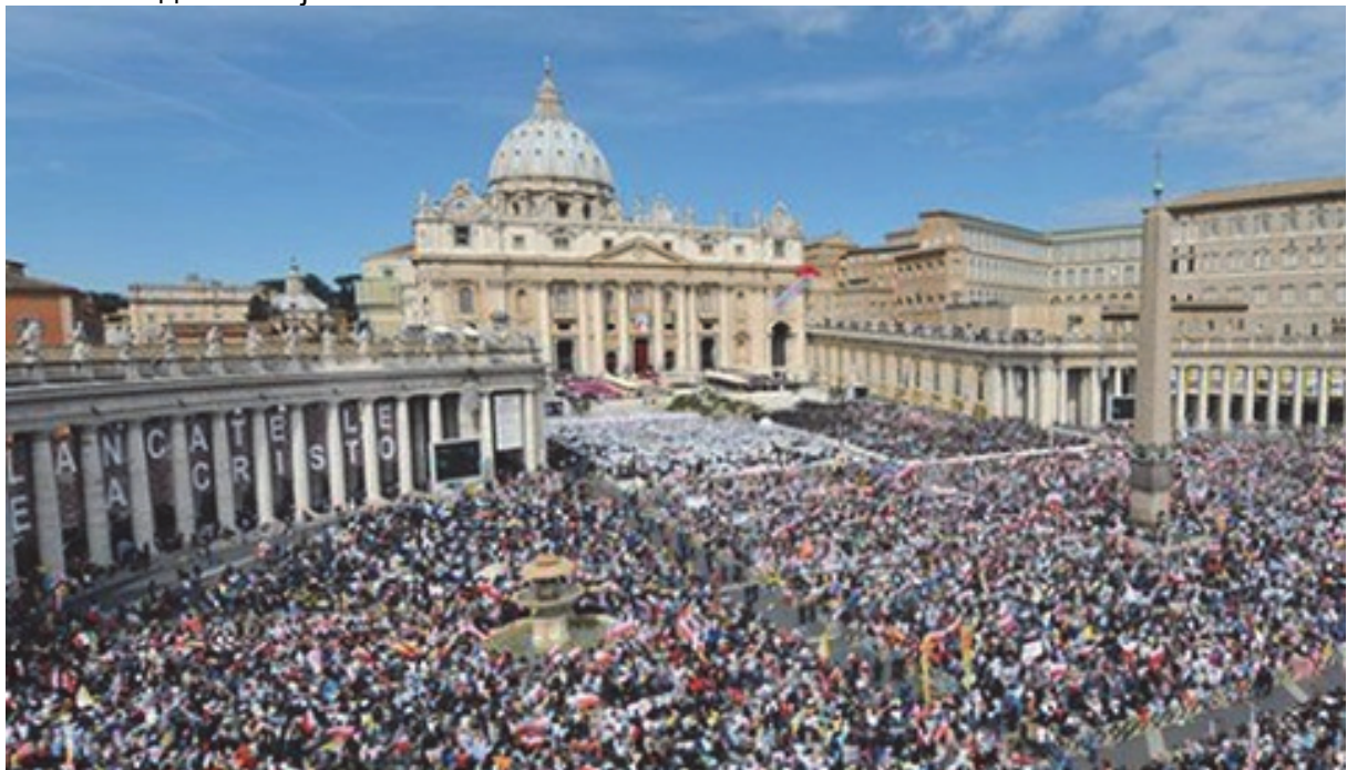
Од прогласувањето на Мајака Тереза за светица

Папата Франциск ја канонизирал Мајка Тереза на 4 септември 2016 година на плоштадот „Свети Петар“ во Ватикан пред десетици илјади луѓе, меѓу кои 15 службени делегации 1.500 бездомни лица од цела Италија, но, за жал е претставена како Албанка од Албанија.