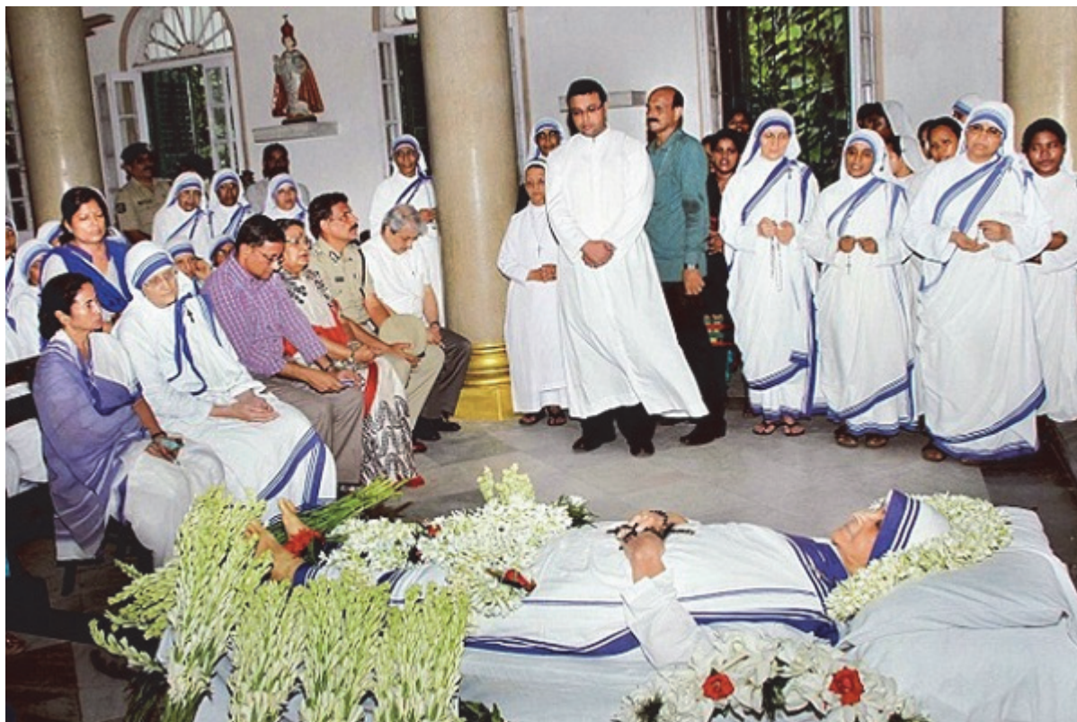
Од погребот на Мајка Тереза

На 24 мај 1931 година, Гонца Бојаџиу ја донесува својата судбоносна одлука - го менува своето име и го зема монашкото име во чест на света Тереза од Авила, шпанска калуѓерка од XVI век и станува Мајка Тереза. Таа се соочува со страдањата на луѓето низ улиците на Калкута, каде предано работи на нејзиното мисионерство подолг временски период.