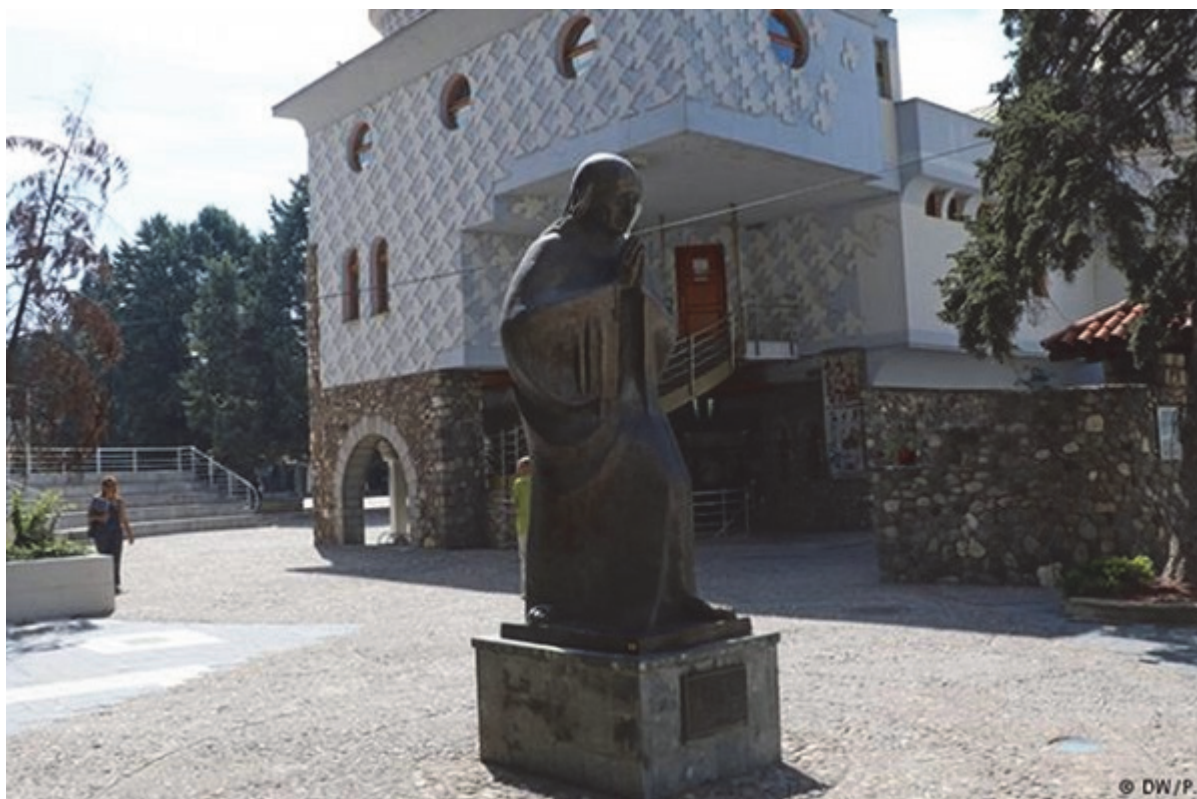
Домот на Мајка Тереза во Скопје

Четири од главните религии во светот: хиндуизмот, будизмот, џаинизмот и сикизмот, потекнуваат од тука, додека зороастризмот, јудаизмот, христијанството и исламот, пристигнале на тие простори во првиот милениум пред нашата ера и го оформиле регионот на разновидни култури. Постепено, припиена од страна на Британската-источноиндиска компанија од почетокот на XVIII век била колонизирана од Велика Британија во средината на XIX век. Индија е независна држава од 1947 година, по борбата за независност која била како отпор предводен од Махатма Ганди.