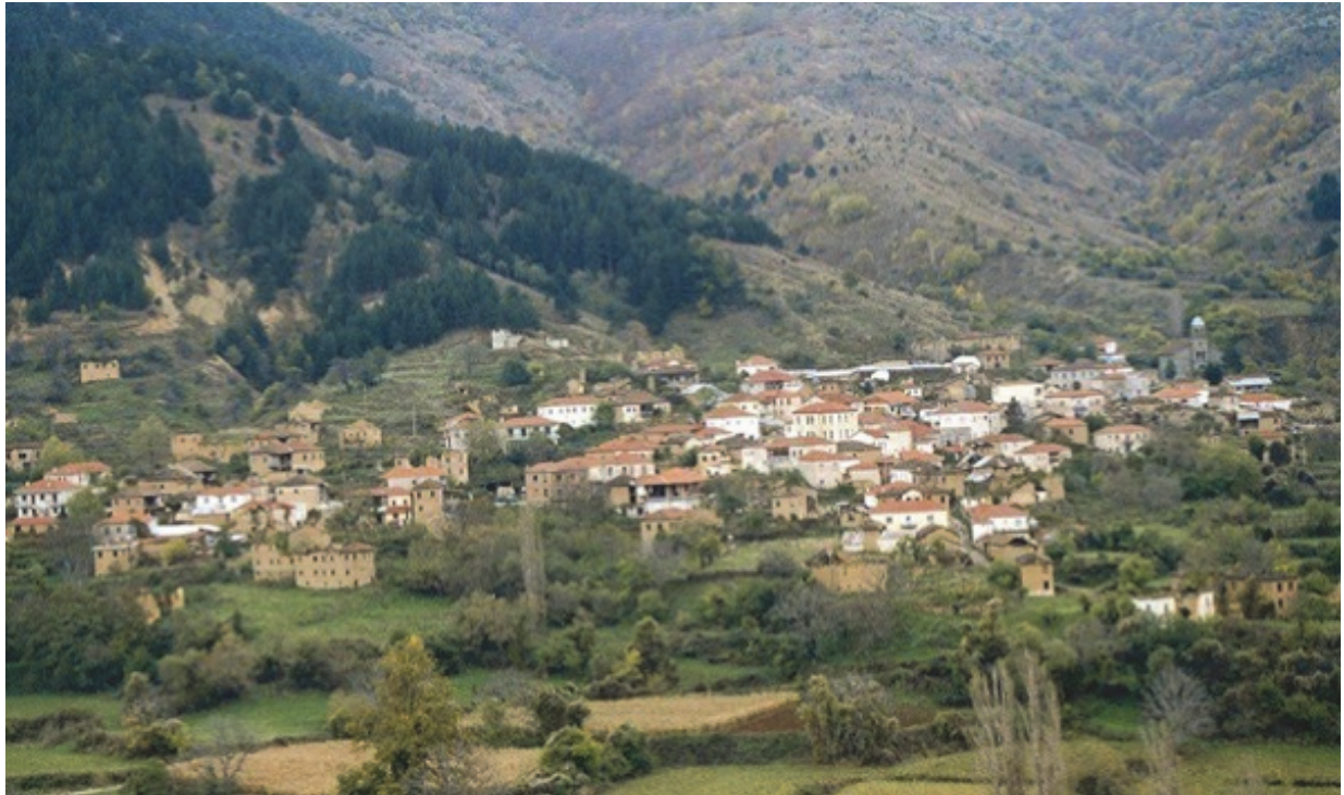
Панорама на селото Желево, Леринско