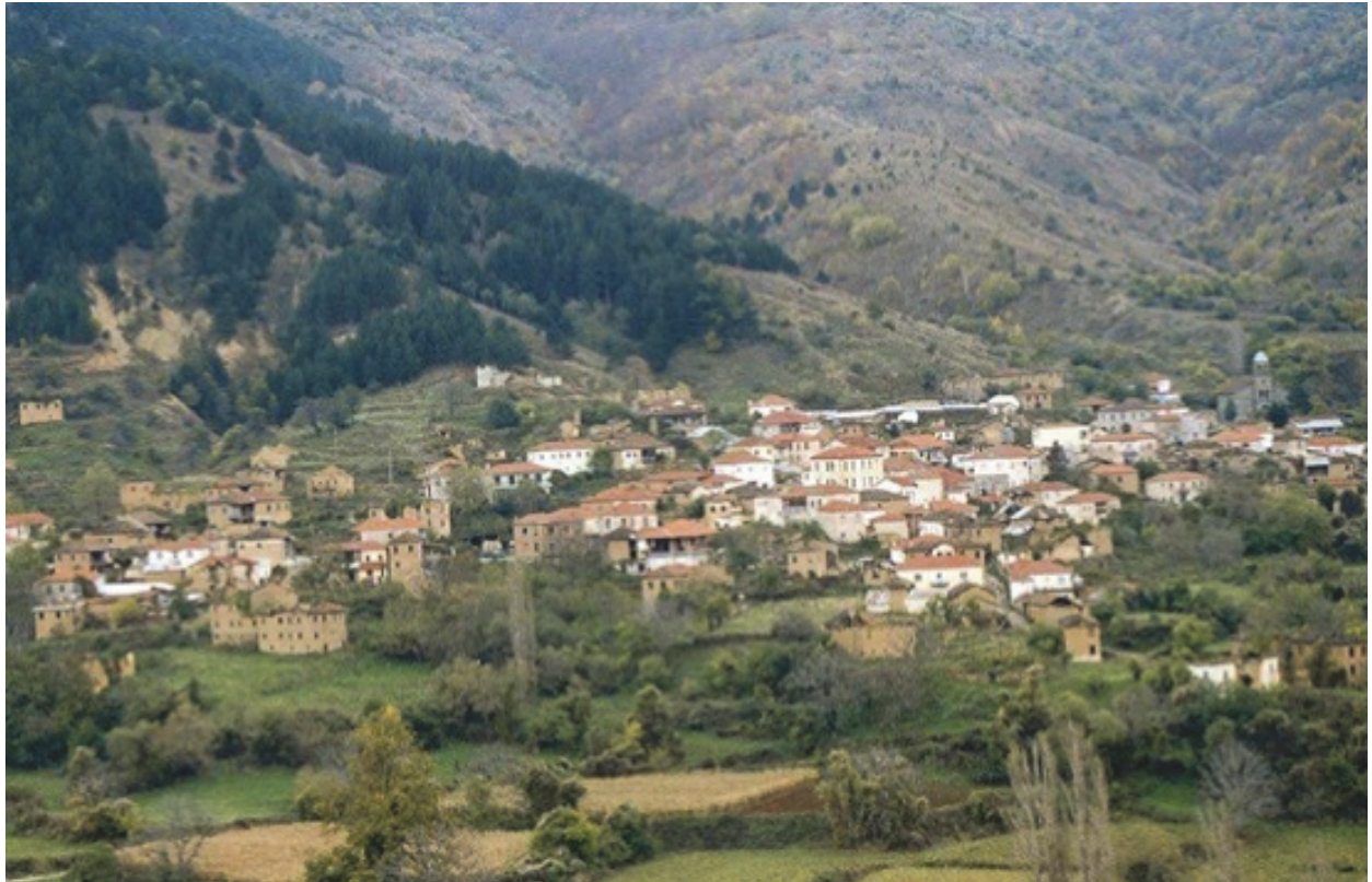
Панорама на селото Желево, Леринско