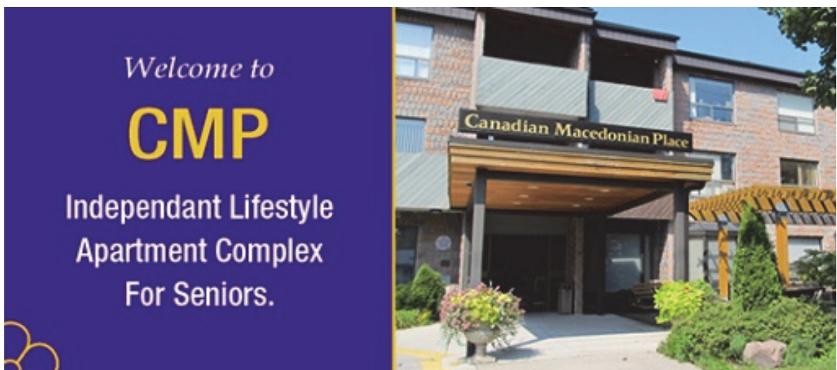
Канадско македонски центар – Старскиот дом