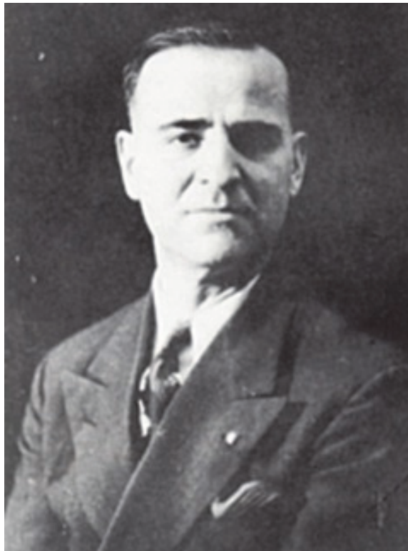
ФОТО ТОМЕВ – ПОЗНАТ ЛИКОВЕН УМЕТНИК И ПУБЛИЦИСТ ВО ТОРОНТО