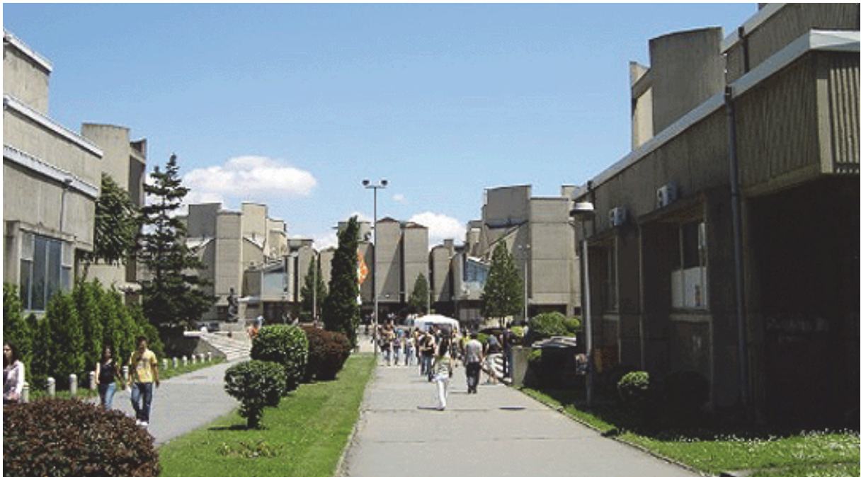
Универзитетот „Свети Кирил и Методиј“