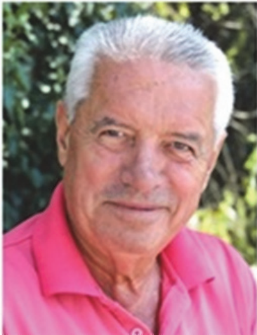
Пишува: СЛАВЕ КАТИН