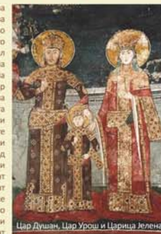
Цар Душан, Цар Урош и Царица Јелена

Цар Урош роден 1336 година седнува на престолот на една огромна држава која е била тешко да се одржи во целина. На самиот почеток од своето владеење се соочува со губење на дел од српска територија во прилог на Византија и самопрогласување на Симеон - Синиша, полубратот на цар Душан, за цар на „Срби, Грци и цела Албанија“. Истовремено е избубната војна на два фронта, на југ со Синоша и на север со Унгарија, при што уште повеќе српска земја се губи. Увидувајќи ја слабоста на цар Урош, владетелите од времето на цар Душан се осмелуваат и почнуваат да се осамостојуваат и грабат што повеќе за себе. Така настануваат областите господари кои се повеќе се издигат и го потиснат цар Урош во сенката на историјата. Како најмоќни области господари се истакнуваат Волкашин Мрњачевиќ и Лазар Хребељановиќ. Во 1366 година Волкашин се прогласува за крал во Призрен како престолнина. Предпоставката е дека Волкашин е совладар со цар Урош но постои и таа можност Урош да е ликвидираан, "Оурош од Мрњачевичка оубиеш бисть". Следува период кога владее беззаконие и војна со рашките владетели. При некој од тие сукоби се убиени повеќе дворјани блиски на цар Урош помеѓу кои највероватно и деспот