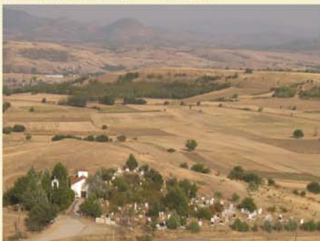
Црква Света Богородица Пречиста - Горгови, Младо Нагоричане