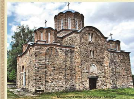
Манастир Света Богородица - Митска