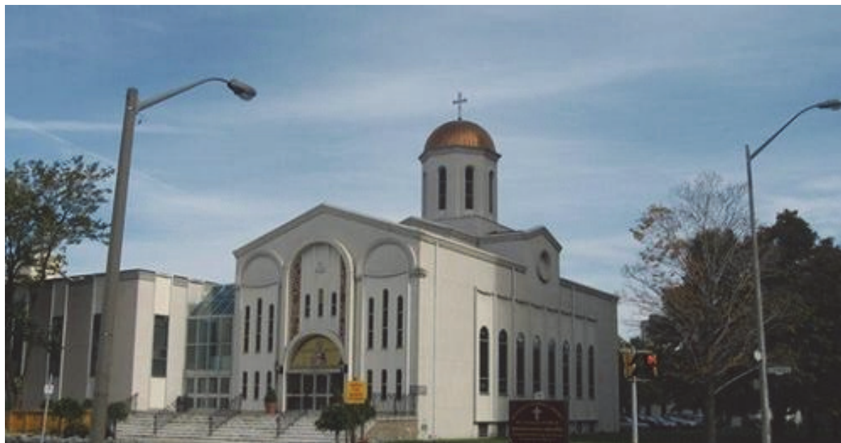
МПЦ „Свети Климент Охридски“ во Торонто

Инаку, македонската православна црква “Свети Климент Охридски“ е стожерот на најголемиот број активности што Македонците ги развиваат во Торонто и пошироко и претставува мотив повеќе за изразување на љубовта и почитта кон родната дедовка земја Македонија