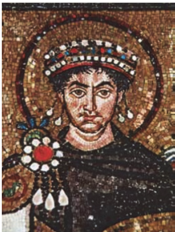
Јустинијан, византиски владетел