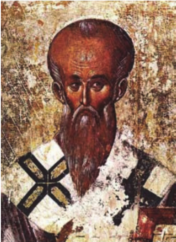
Св. Климент Охридски