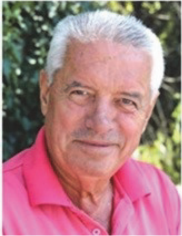
Пишува: СЛАВЕ КАТИН