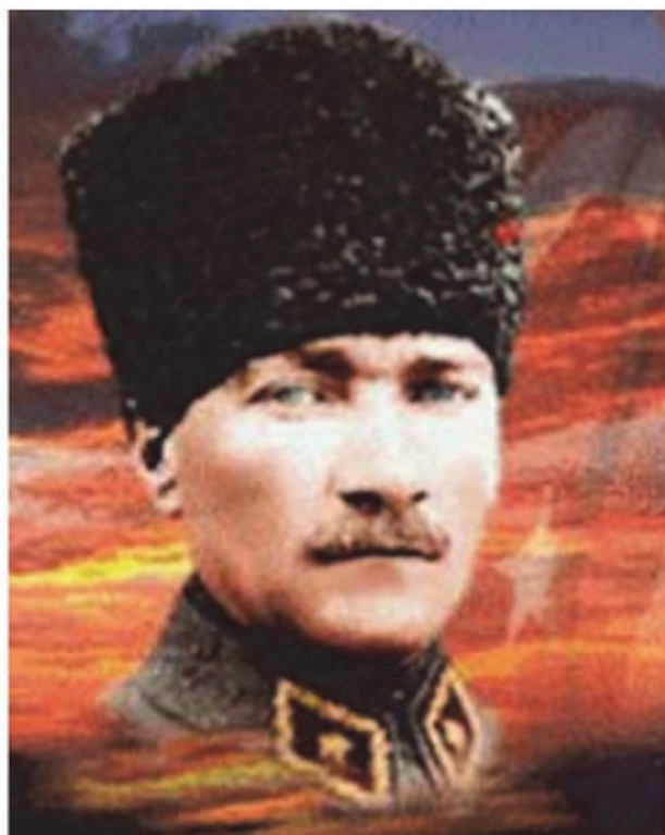
Ататурк, таткото на современа Турција