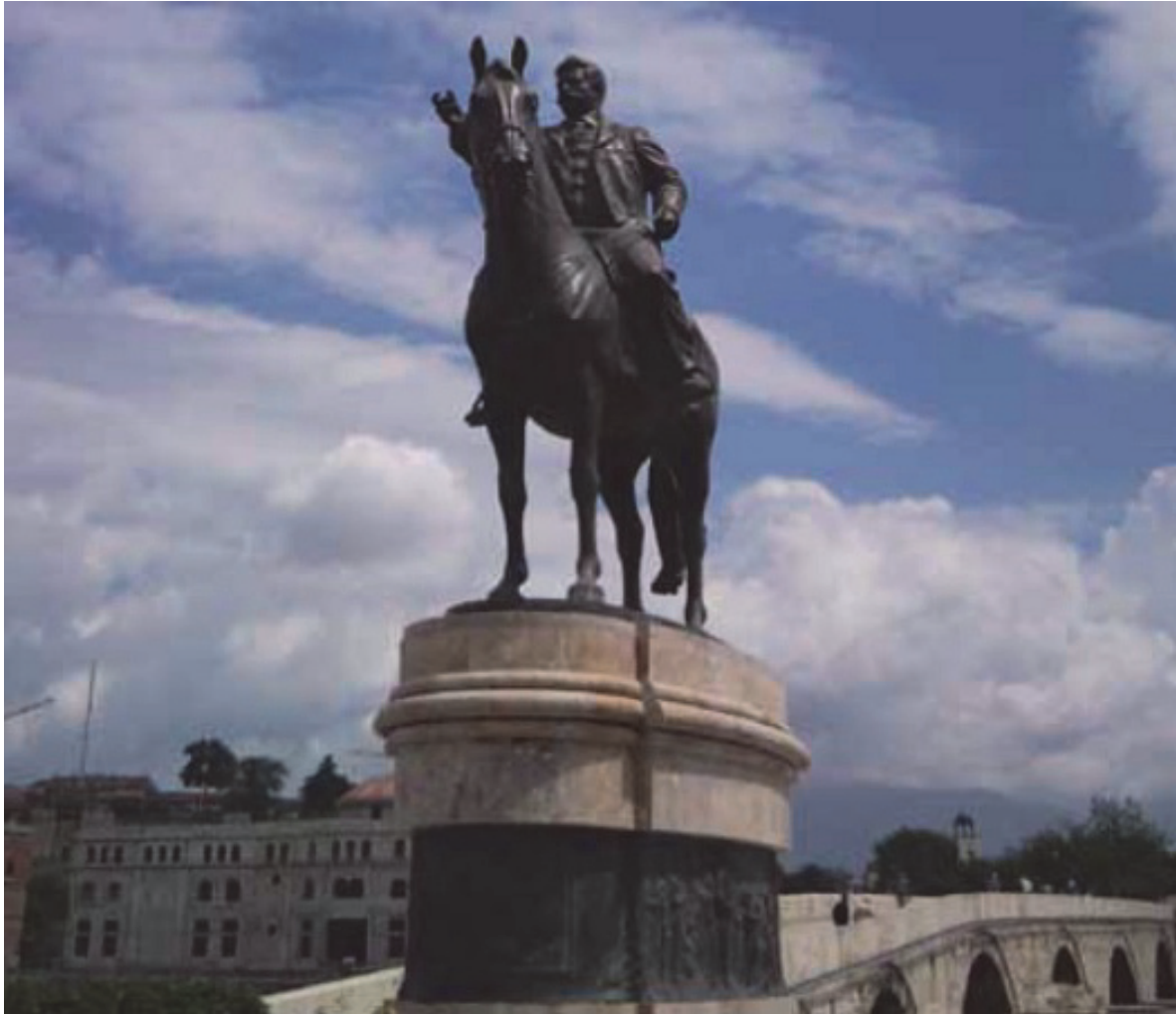
Споменикот на Гоце Делчев во Скопје

применувале строги казни за оние кои се осмелувале да го зборуваат македонскиот јазик. Во Србија, која подоцна прераснала во Кралство на Србите, Хрватите и Словенците, под југословенската монархија, Македонија била колонизирана. На Македонците повторно им бил негиран националниот идентитет, а нивниот јазик бил потиснат. Слична била нивната судбина и во Бугарија, во Пиринска Македонија.