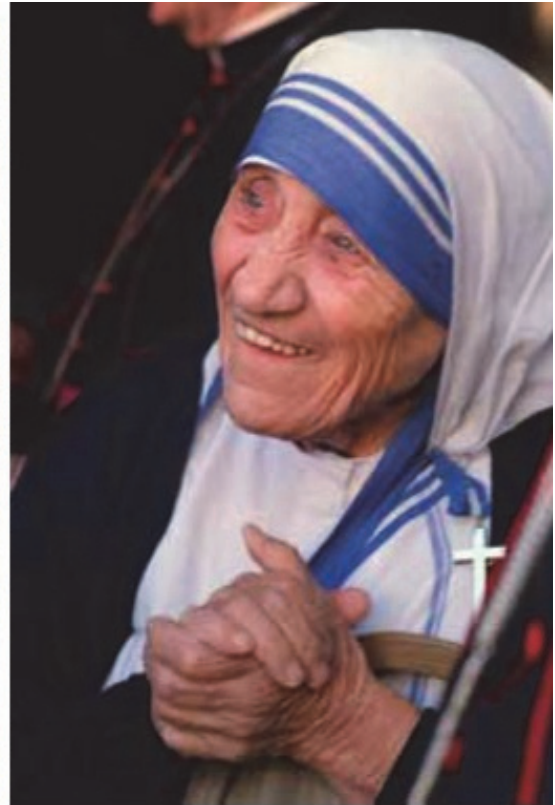
Света Мајка Тереза

Така, според истражувањата на етнологите и антрополозите, времетраењето на месеците во народната култура на Македонците, најчесто се пресметувало и одредувало според одредени празнични денови, нарекувани меѓници или синори . Тоа се големите христијански празници кои ги има во секој месец од годината. Времетраењето на месеците во народното живеење на Македонците изгледало вака: