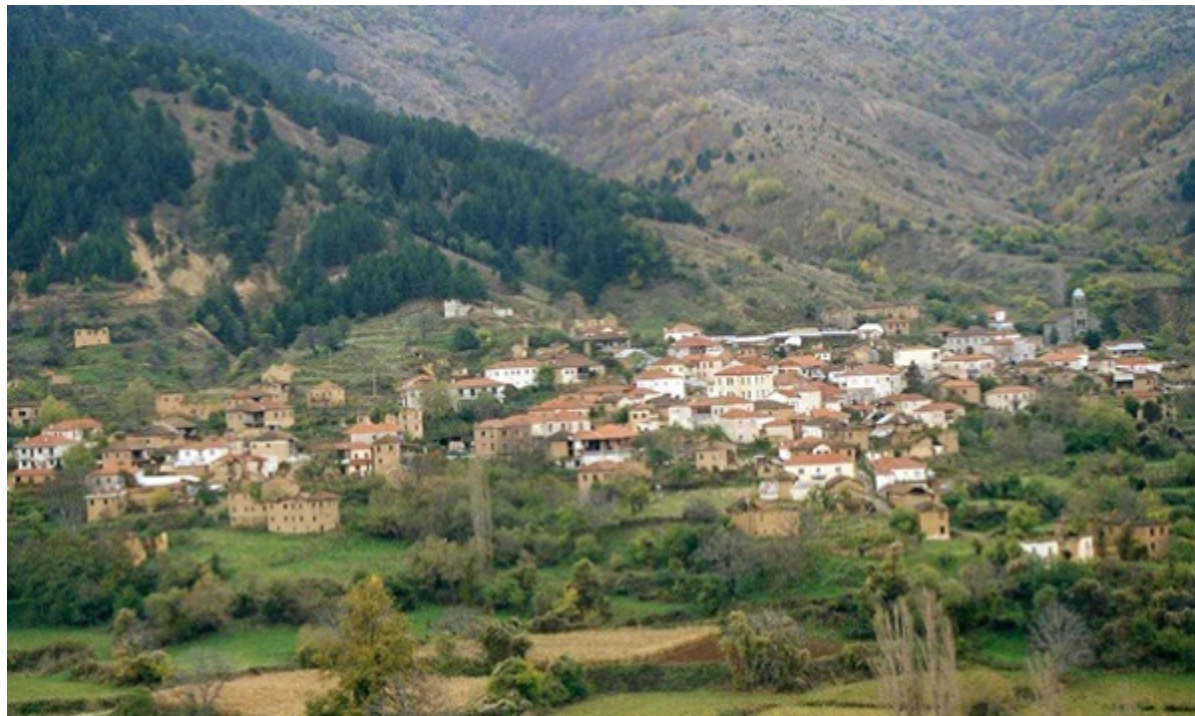
Панорама на селото Желево, Леринско