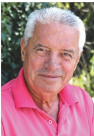
Пишува: СЛАВЕ КАТИН

Исто така, За прославата на неговиот 100 годишен роденден Македонскиот радио час „Оро Македонско“ му подари посебна Благодарница за неговиот придонес во Македонската заедница во Флорида, со желба за добро здравје.