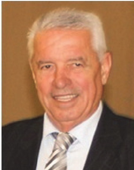
Пишува: СЛАВЕ КАТИН

Посебна улога во организирањето и работата на Македонската студентска организација одигра Катедрата по македонски јазик, а одржува многу тесна соработка со повеќе етнички студентски организации. Во Торонто има Македонска студентска организација во рамките на универзитетот „Јорк“ и на Политехничкиот институт во овој град.