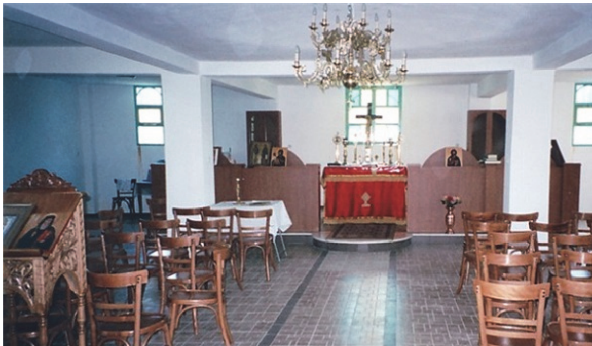
Внатрешниот дел на црквата „Света Злата Мегленска“