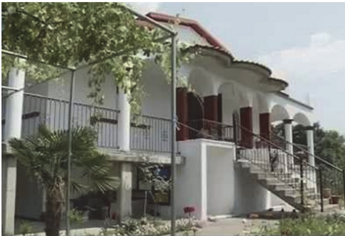
Црквата „Света Злата Мегленска,, во Сobotско

Уште како дете, неговите родители го воспитувале да биде добар христијанин и свесен Македонец. Тргувајќи по стапките на своите родители, тој станува вљубеник во Бога, добар човек, но и горд Македонец. Како свештеник ќе го проповеда Словото Божјо и Исусовите страдања, но, и за страдањата на македонскиот народ. Со пастирска љубов, тој застанува на чело на својот напатен народ за да се справи со проблемите со кои се соочуваат етничките Македонци во Грција.