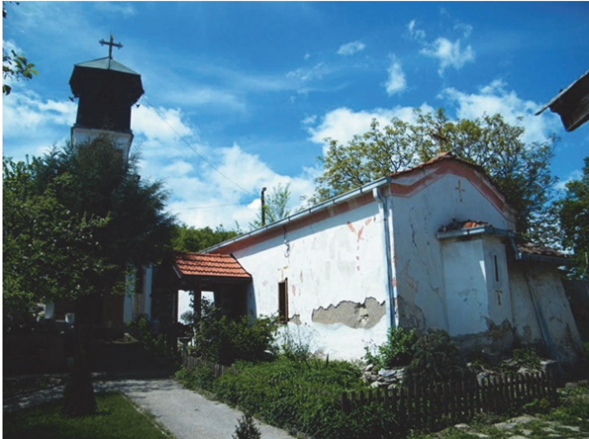
„Свети Горѓи“ Кучково, Скопско

Ваквиот став на Грција, ќе инструира деца кои вандалски ќе се однесуваат кон Црквата и неговиот дом во С'ботско, а Царкњас ќе биде осуден во 2004 година на три месеци затвор за воспоставување и работење на Црква без дозвола, а во 2009 година без докази судот го осудува Царкњас на шест месеци затвор за претепување на 12 годишно дете кое во 2002 година фрлало со јајца и камења врз неговиот дом, иако Царкњас само го привел до полициската станица.