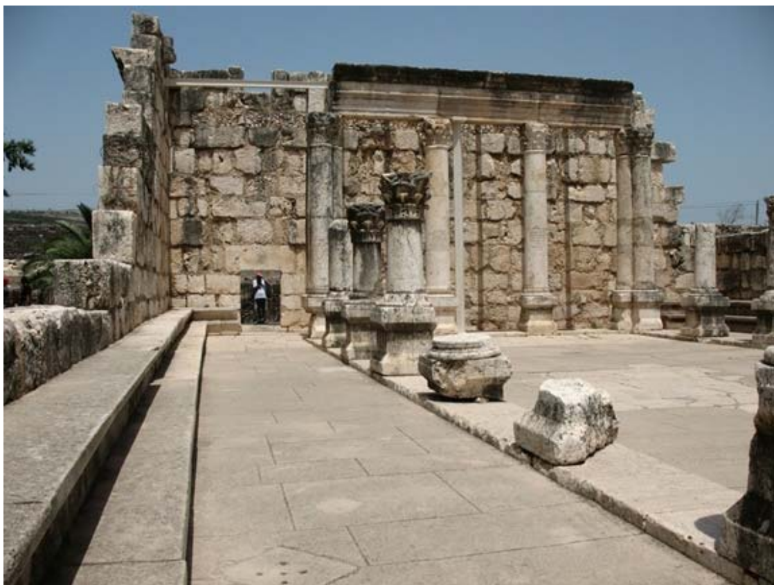
Капернаум во Израел

Христијанството во Македонија започнало да се проповеда уште во апостолско време. По прифаќањето на христијанството, апостол Павле станал првиот проповедник на новото месијанско учење при своите мисионерски патувања. Апостол Павле, за време на својата мисионерска дејност, спровел повеќе мисионерски и благовеснички патувања, во текот на коишто тој го проповедал христијанството меѓу еврејското и паганското население. Апостол Павле во Македонија престојувал четири пати.