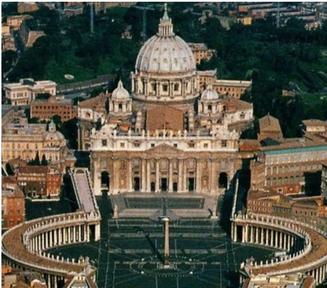
Ватикан - местото на апостол Павле

По враќањето во Ерусалим, во почетокот, неговите истомисленици се сомневале во него, не му верувале. На своето прво мисионерско патување, бил испратен од страна на Барнаба, кој претходно го внел во заедницата на Ерусалимската црква. Проповедал во Антиохија, Киликија, Кипар, Ефес, Атина, Македонија, Коринт, Шпанија и некои тогашни земји.